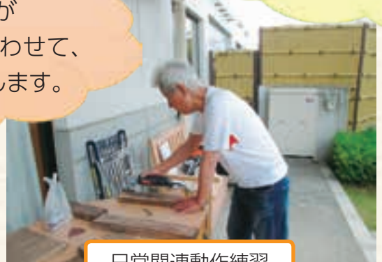
日常関連動作練習