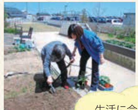
生活に合わせた (畑・手芸・日用大工の も行います)